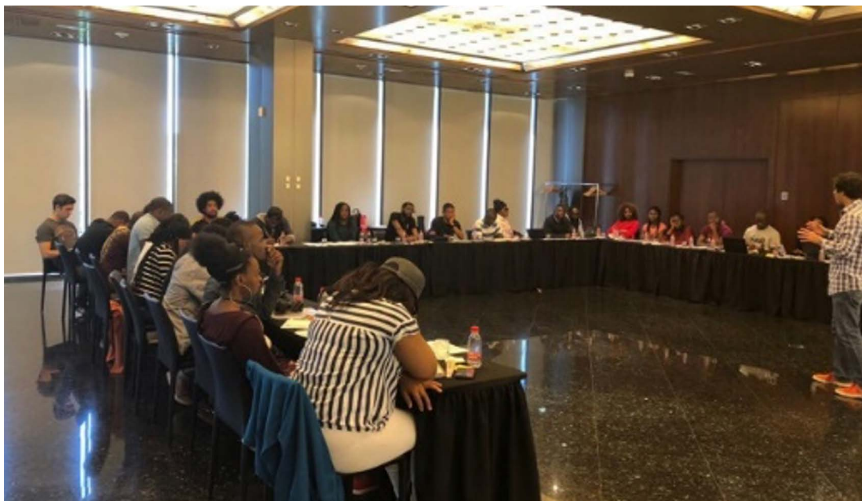
Formación con activistas de la sociedad civil locales y de la diáspora en Madrid.

Las becas para estudiantes ecuatoguineanos, especialmente mujeres y estudiantes de primera generación de familias con bajos ingresos, ofrecerían