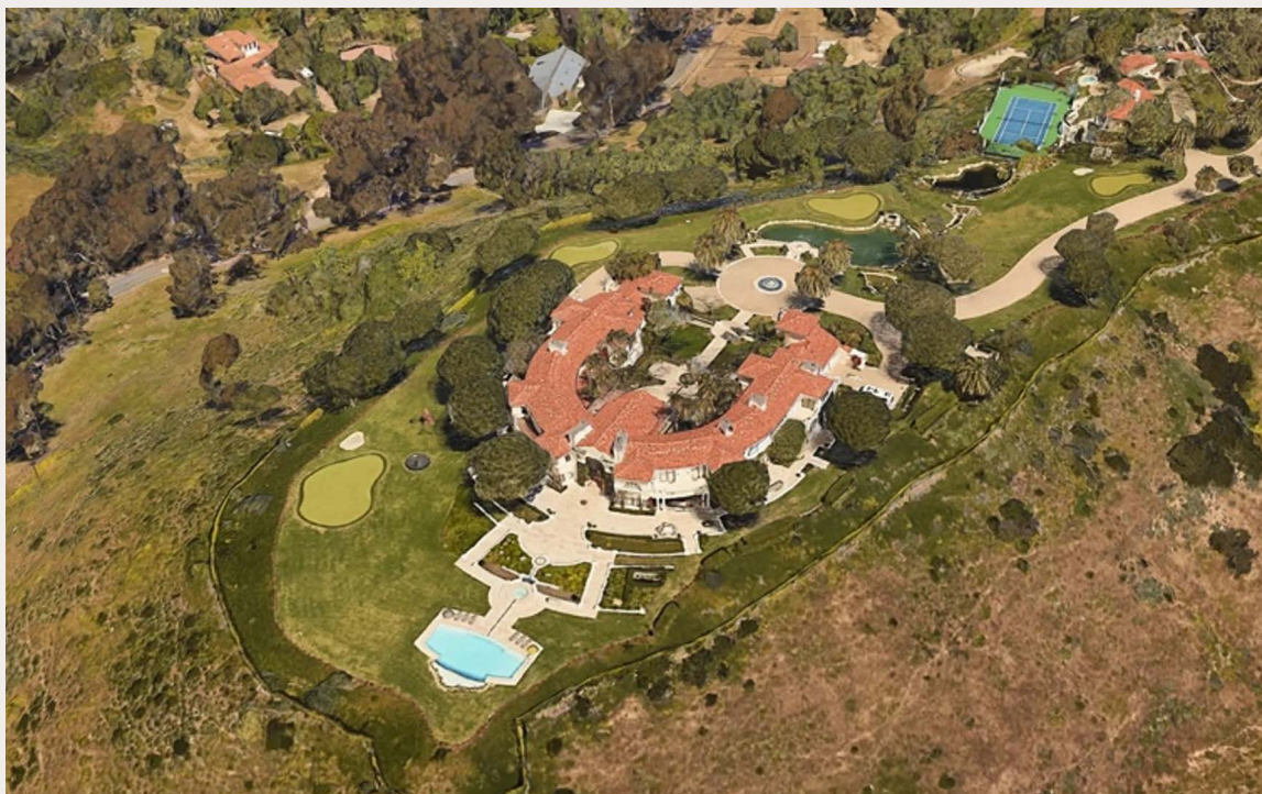
La mansión de Teodorín en Malibú, incautada por las autoridades estadounidenses en 2011.

Según los términos de dicho acuerdo, dos tercios de los fondos disponibles deben distribuirse a través de un proceso acordado entre EE.UU. y Teodorín, mientras que EE.UU. puede distribuir el tercio restante discrecionalmente, en beneficio de la población de Guinea Ecuatorial. Los 26,6 millones de dólares se destinaron a vacunas contra la COVID-19 para la población de Guinea Ecuatorial, y los 10,3 millones aún no se han reasignado.