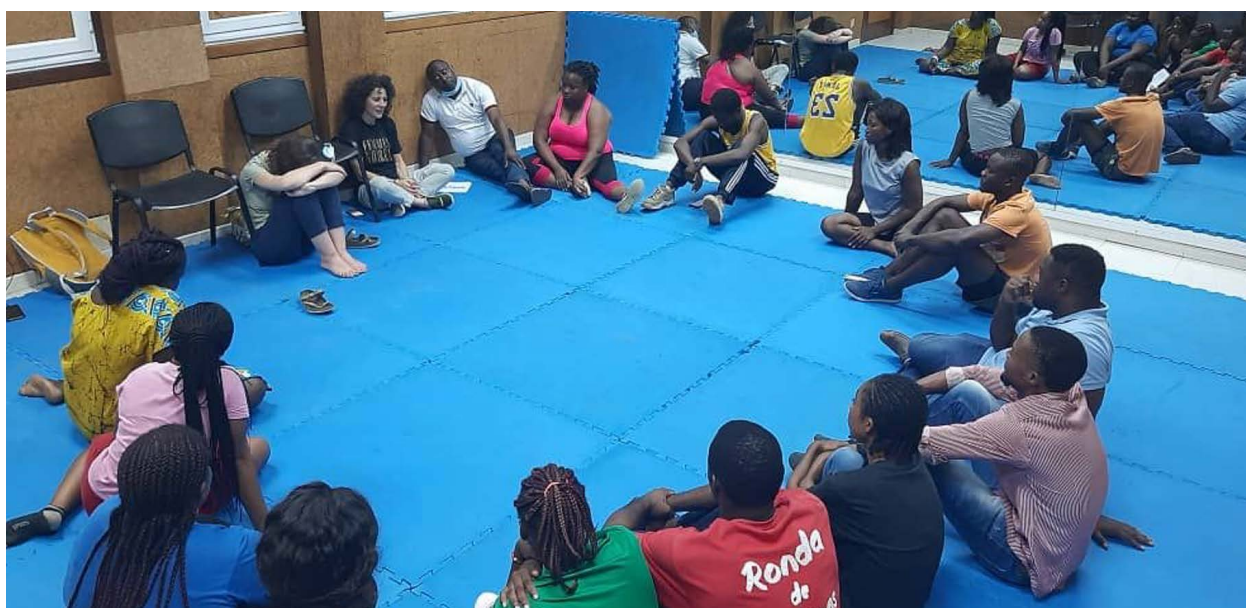
Fotos de la formación de la sociedad civil en Guinea Ecuatorial (Fotos de LPC).