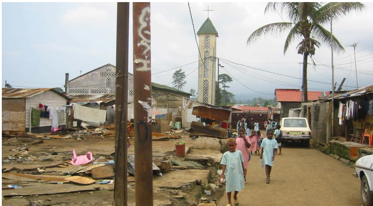
Escolares en Guinea Ecuatorial, que ocupa el puesto 145/189 en el índice de desarrollo humano de la ONU.

Las normas internacionales -de manera especial, la Convención de la Naciones Unidas contra la Corrupción (CNUCC)- establecen que los gobiernos deben repatriar el producto de la corrupción de manera responsable, transparente y rindiendo cuentas para reparar el daño causado a las víctimas de la corrupción. La participación de la sociedad civil es fundamental en este proceso.