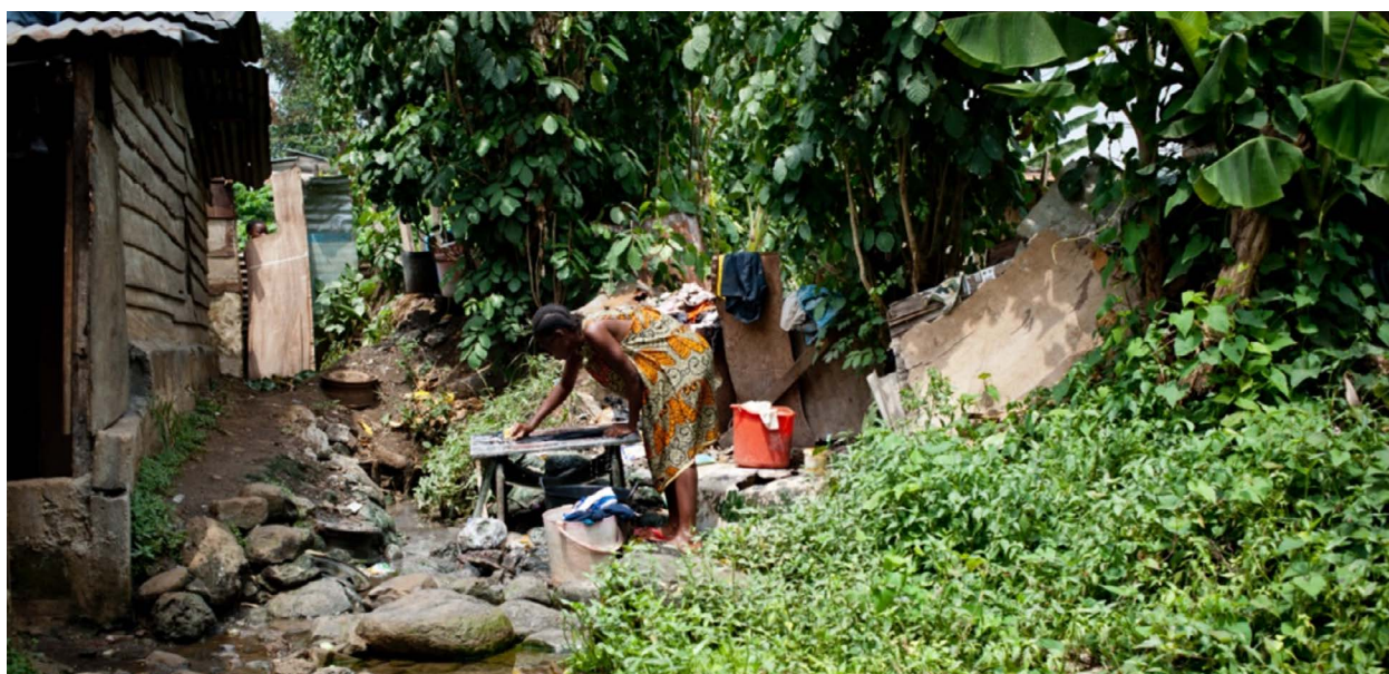
Mujer de Guinea Ecuatorial lavando ropa.