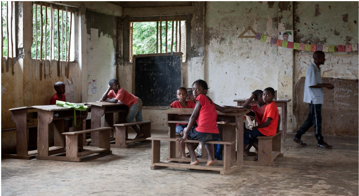
Escuela en la isla de Bioko, Guinea Ecuatorial.

la oportunidad de asistir a la universidad en otro país africano o en el extranjero, donde los estudiantes pueden adquirir la educación y las habilidades que necesitan y traerlas de vuelta a Guinea Ecuatorial. Estructura propuesta: