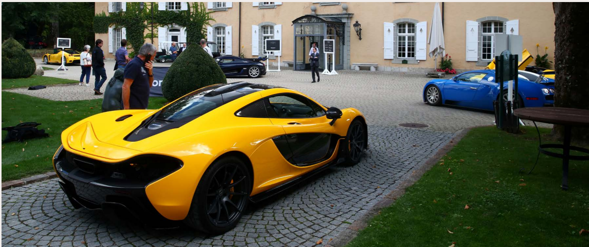
Fotografía de los coches incautados a Teodorín Nguema Obiang.

En octubre de 2019, el gobierno suizo subastó 25 coches de lujo que había incautado a Teodorín como parte de un acuerdo, tras una investigación por corrupción. Previamente había sacado ilegalmente de Holanda su yate "Ice", antes de que las autoridades suizas pudieran incautárselo, y, como parte del acuerdo judicial, se le devolvió su otro yate "Ebony Shine". Según los términos del acuerdo, Suiza debe repatriar los 24 millones de dólares recaudados por la venta de los coches mediante una entidad internacional que lo pudiese utilizar en Guinea Ecuatorial. No está claro de qué entidad o entidades internacionales se tratará ni cómo el gobierno suizo devolverá, desembolsará y supervisará la devolución de estos activos.