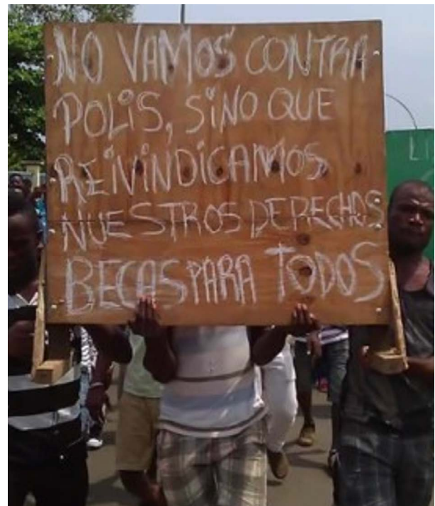
University students protesting the lack of scholarships in Equatorial Guinea (Photo by Diario Rombe).

cumplir unos requisitos académicos mínimos y comprometerse a regresar a Guinea Ecuatorial al término de sus estudios durante un periodo de tiempo determinado.