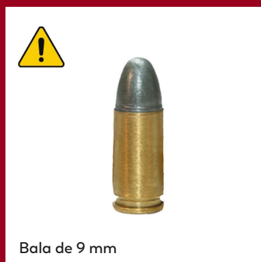
Bala de 9 mm

A pesar de estas normas, se siguen documentando en todo el mundo incidentes que implican el uso de munición real contra manifestantes. Un tipo comúnmente utilizado en contextos de control de multitudes son las escopetas cargadas con perdigones o postas letales, múltiples bolas de metal o balines de distintos tamaños que se dispersan en una amplia área una vez disparados. Además de su letalidad para los objetivos previstos, este tipo de munición también es intrínsecamente imprecisa y supone un riesgo significativo de lesión o muerte para los transeúntes.