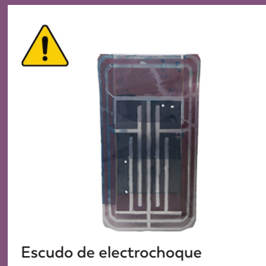
Escudo de electrochoque