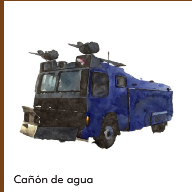
Cañón de agua