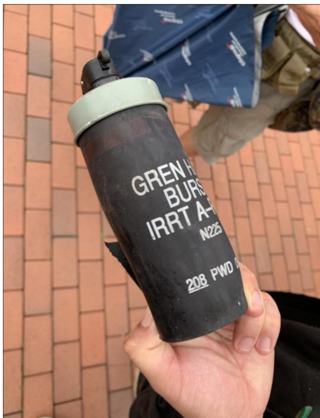
Granada de humo de CS, de caucho, estallando

Cuando las probabilidades de fortalecer controles comerciales nacionales sean limitadas, una estrategia alternativa es centrarse en detener el flujo de equipamiento intrínsecamente agresivo en su origen. Si las pruebas que ha reunido sugieren que se han importado armas o equipamiento específicos, entonces los observadores deberían intentar trabajar con organizaciones en el país de origen, las cuales podrían comunicarse con las autoridades de control de exportaciones pertinentes. Compartir las pruebas que ha reunido puede ayudar a organizaciones amigas a crear una campaña convincente basada en pruebas que puede tener el potencial de garantizar la suspensión o denegación de licencias o generar escrutinio público que incite a las empresas a desistir de futuras transferencias. Este enfoque es especialmente eficaz si el país exportador cuenta con controles de exportación bien establecidos sobre la exportación de equipamiento para mantener el orden público.