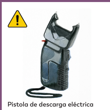
Pistola de descarga eléctrica