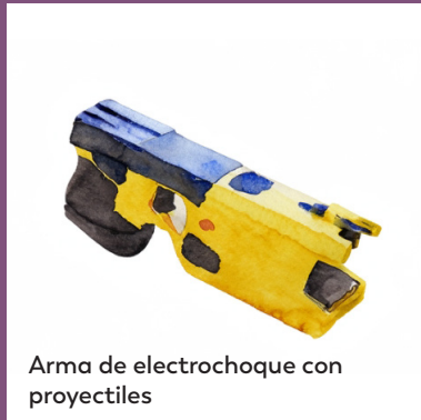
Arma de electrochoque con proyectiles

Las armas de electrochoque por contacto directo, tales como las pistolas de descarga eléctrica o las porras eléctricas, así como los escudos de electrochoque, emiten un choque eléctrico cuando se presionan directamente contra la persona. Estos dispositivos pueden ocasionar dolor localizado intenso pero generalmente no producen incapacidad neuromuscular y jamás deberían ser utilizados por las fuerzas del orden público.