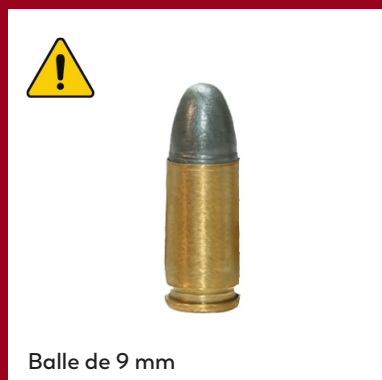
Balle de 9 mm

Malgré ces normes, des incidents impliquant l'utilisation de munitions réelles contre des manifestants continuent d'être signalés dans le monde entier. Les fusils de chasse chargés de plombs mortels ou de chevrotine, c'est-à-dire de multiples billes métalliques ou plombs de tailles variables qui se dispersent sur une large zone lorsqu'ils sont tirés, constituent un type de munitions couramment utilisé dans le cadre du contrôle des foules. Outre leur létalité pour les cibles visées, ce type de munitions est également intrinsèquement imprécis et présente un risque important de blessure ou de mort pour les passants.