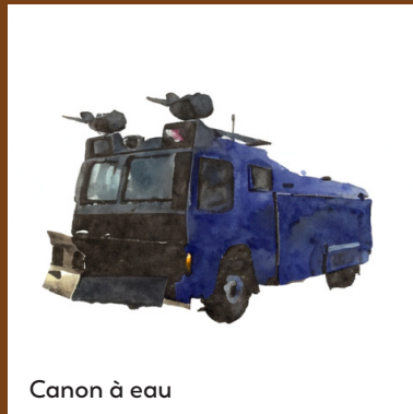
Canon à eau