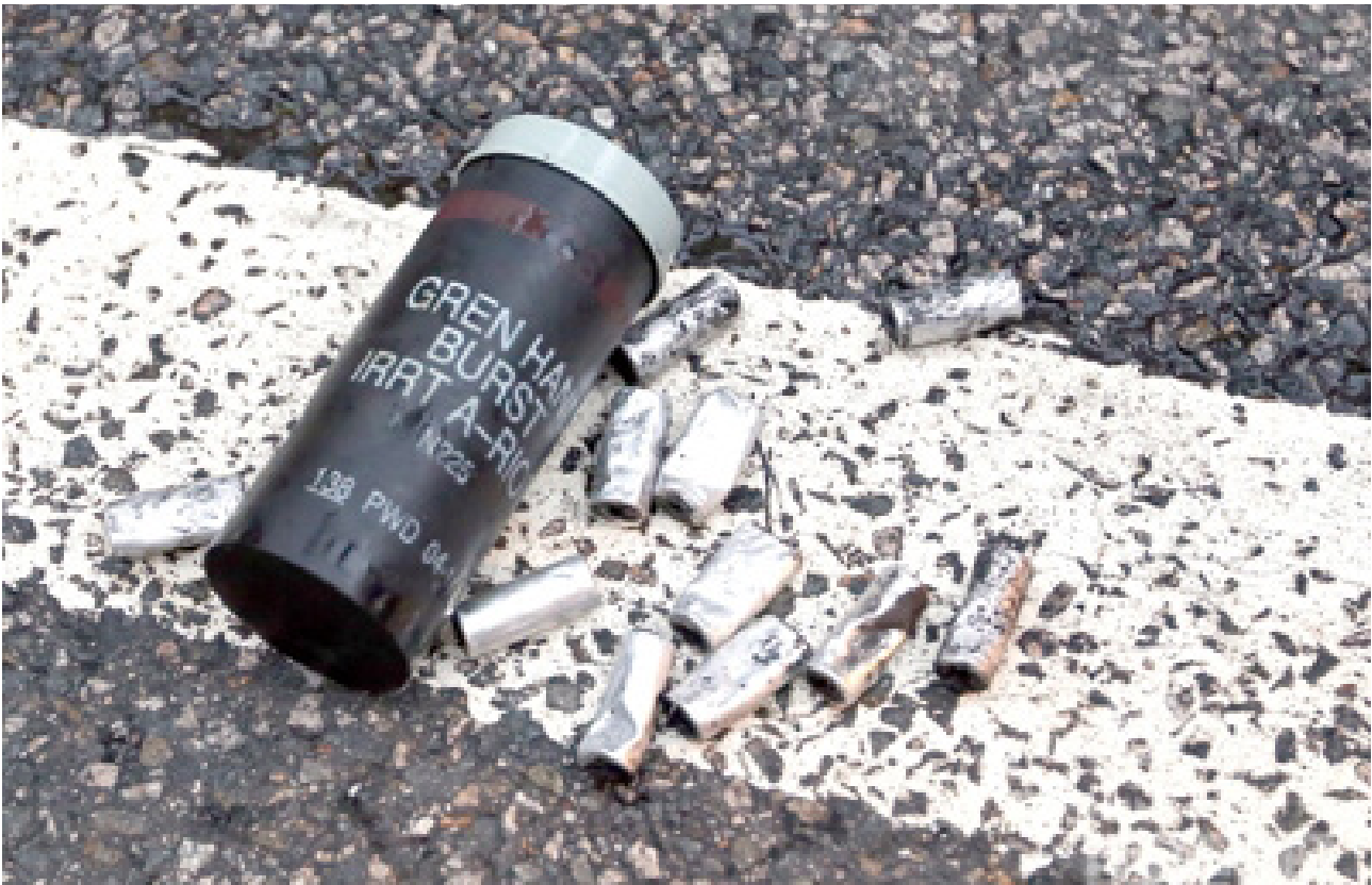
Une grenade lacrymogène N225 présentant des marquages identifiables, qui peuvent aider à déterminer le type, les caractéristiques et l'origine du dispositif.