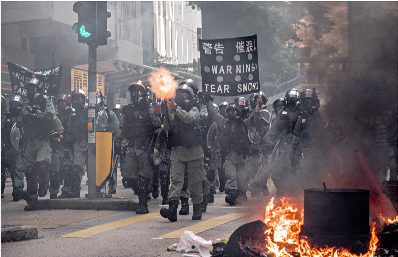
La police de Hong Kong a tiré des gaz lacrymogènes pour disperser la foule lors d'une manifestation pro-démocratie en 2019.