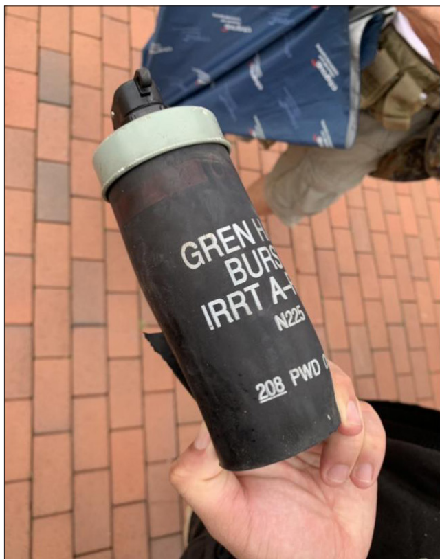
Grenade fumigène CS à éclatement en caoutchouc

Lorsque les perspectives de renforcement des contrôles commerciaux nationaux sont limitées, une stratégie alternative consiste à se concentrer à stopper le flux d'équipements intrinsèquement abusifs à la source. Si les preuves que vous avez recueillies suggèrent que des armes ou des équipements spécifiques ont été importés, les observateurs devront alors tenter de collaborer avec des organisations du pays d'origine, qui pourraient être en mesure d'intervenir auprès des autorités compétentes en matière de contrôle des exportations. Le partage des preuves que vous avez recueillies peut aider les organisations partenaires à mettre en place une campagne convaincante, fondée sur des preuves, susceptible d'aboutir à la suspension ou au refus de licences, ou de susciter une attention publique qui pourrait inciter les entreprises à cesser tout transfert futur. Cette approche s'avère particulièrement efficace lorsque le pays exportateur dispose de contrôles à l'exportation bien établis concernant les équipements destinés aux forces de l'ordre.