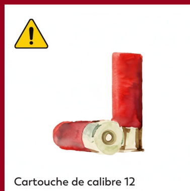
Cartouche de calibre 12