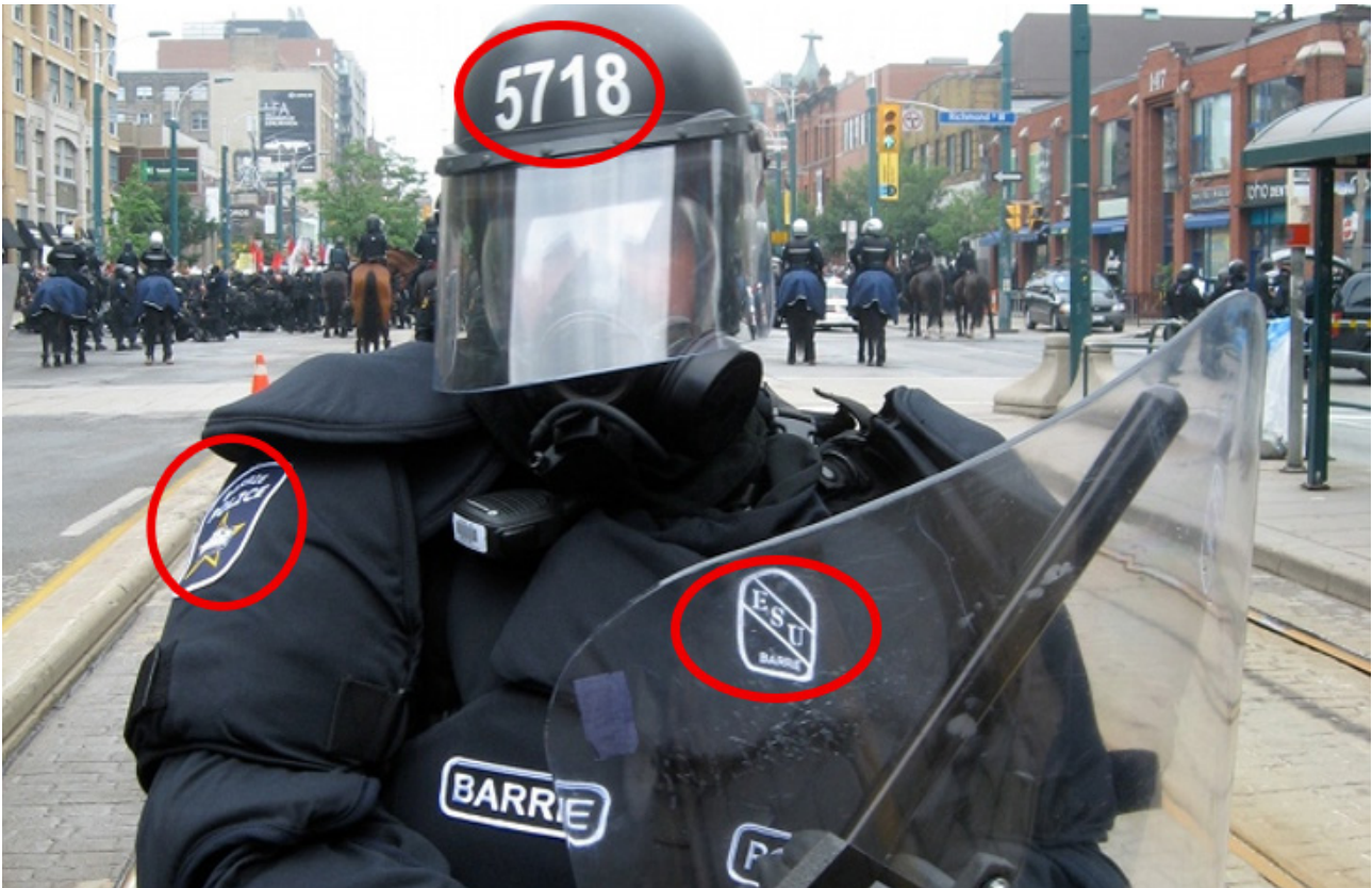
Un policier en uniforme, dont le casque, les épaulettes, les manches ou la poitrine portent des insignes et autres éléments d'identification.

en soi constituer une violation des normes internationales ou du droit national ; veillez donc à noter s'il n'y a aucun identifiant visible. 5 Dans certains pays, les numéros d'identification peuvent être vérifiés à l'aide de bases de données accessibles au public.