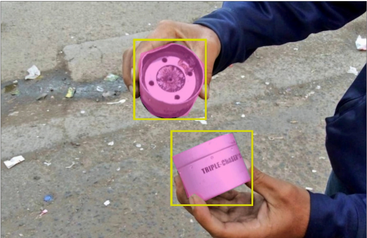
© Forensic Architecture. Forensic Architecture a utilisé l'intelligence artificielle pour identifier les grenades lacrymogènes lors des manifestations.

Lorsqu'on préconise des essais approfondis, il peut être utile de se référer aux normes techniques internationales établies concernant la conception sûre des armes moins létales. Par exemple, les directives des Nations Unies relatives aux armes non létales dans le cadre du maintien de l'ordre (2020) fixent des critères de performance acceptables pour les armes utilisées par les forces de l'ordre, précisant notamment que les projectiles à impact cinétique doivent être suffisamment précis pour atteindre une cible dans un cercle de 10 centimètres de diamètre autour du point de visée prévu, à la distance recommandée. Plus généralement, la liste des armes intrinsèquement abusives établie par le rapporteur spécial sur la torture constitue là encore un point de référence utile pour identifier les équipements qui devraient être purement et simplement rejetés par les forces de l'ordre.