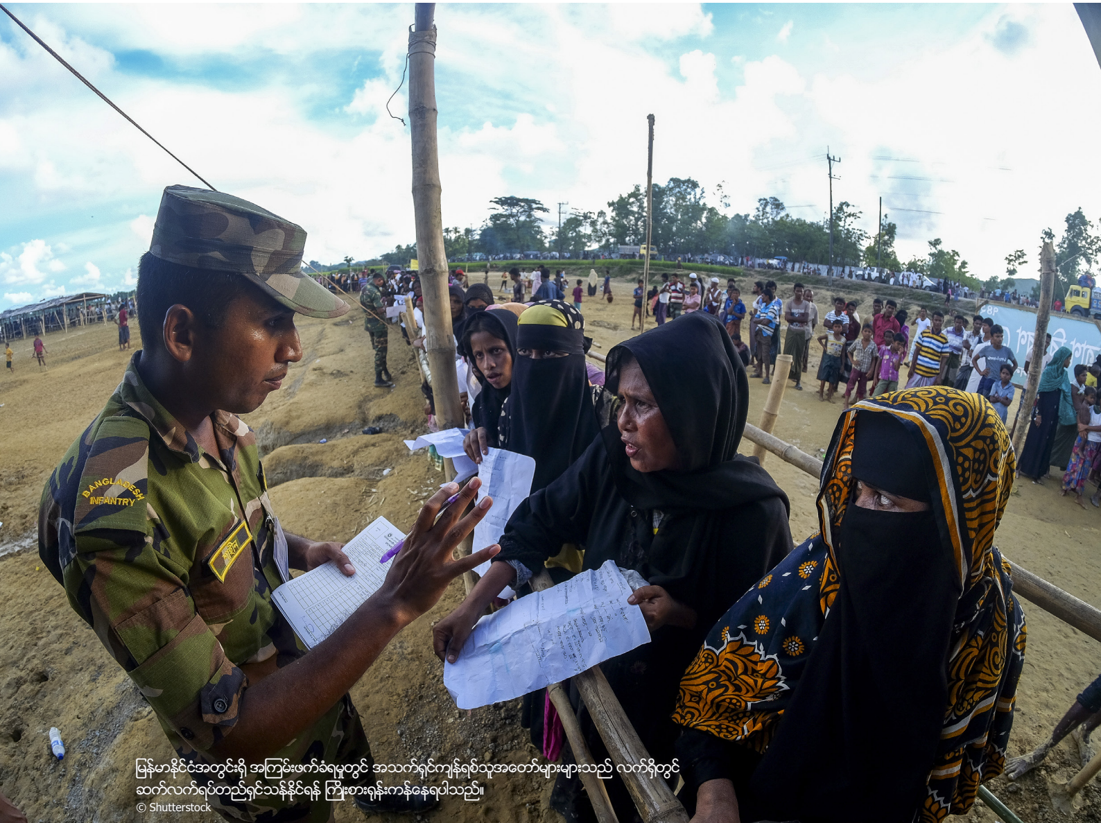
မြန်မာနိုင်ငံအတွင်းရှိ အကြမ်းဖက်ခံရမှုတွင် အသက်ရှင်ကျန်ရစ်သူအထောက်အထားများသည် လက်ရှိတွင် ဆက်လက်ရပ်တည်ရှင်သန်နိုင်ရန် ကြိုးစားရုန်းကန်နေရပါသည်။

[SGBV] သည် အစိုးရလုံခြုံရေးတပ်ဖွဲ့များက ကျူးလွန်သည်ထက် နည်းပါးသည်” နှင့် EAO တိုက်ခိုက်ရေးသမားများသည် “အရပ်သားလူထုကို ပစ်မှတ်ထားရန် တူညီသောရည်ရွယ်ချက်ဖြင့် [SGBV] ကို ကျူးလွန်ခြင်း မပြု” ဟု ကောက်ချက်ချခဲ့ခြင်းဖြစ်သည်။ 161