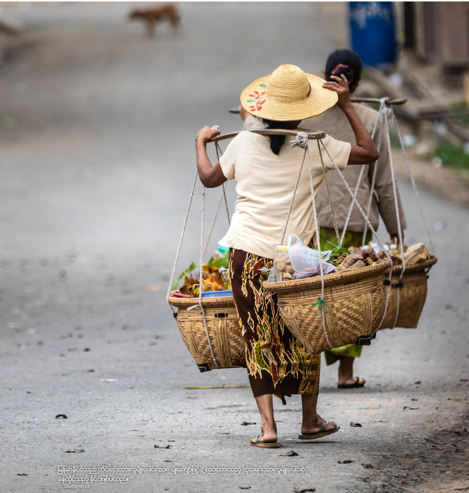
မြန်မာနိုင်ငံသည် တိုင်းရင်းသားလူမျိုးပေါင်း ၁၃၅ မျိုးကျော်ဖြင့်ဖွဲ့စည်းထားသည့် တိုင်းရင်းသားလူမျိုးပေါင်းစုံ နေထိုင်သည့် နိုင်ငံဖြစ်ပါသည်။