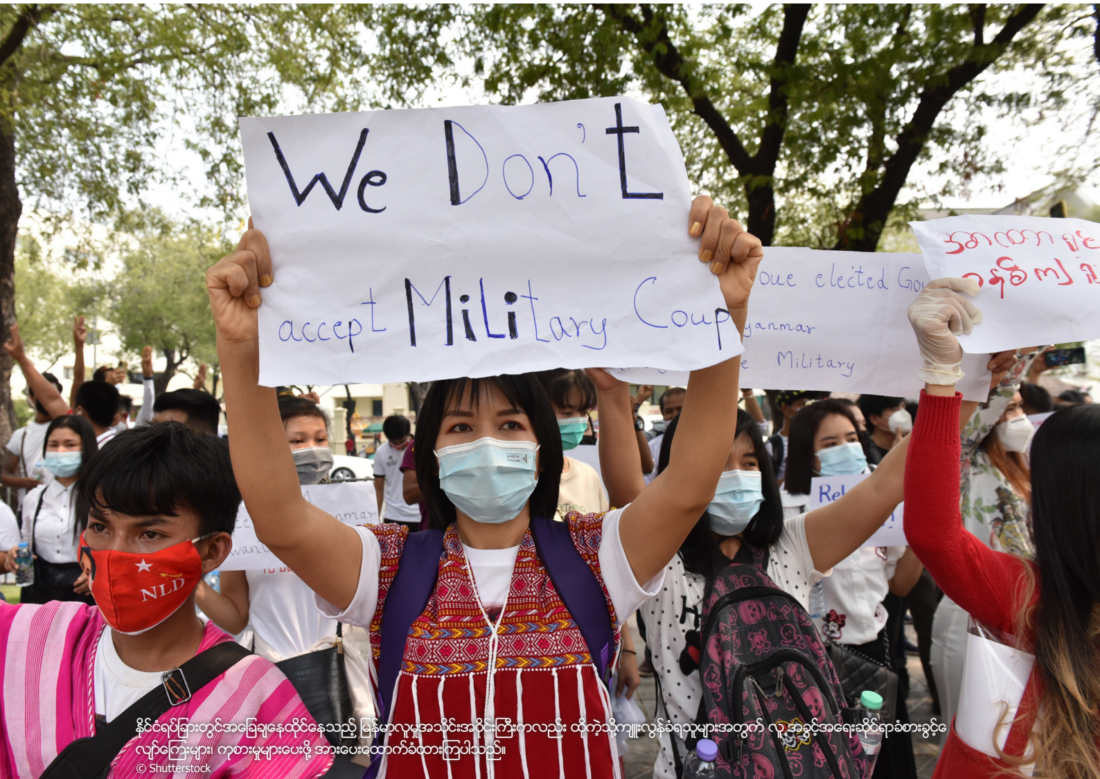
နိုင်ငံရပ်ခြားတွင်အခြေချနေထိုင်နေသည့် မြန်မာလူမှုအသိုင်းအဝိုင်းကြီးကလည်း ထိုကဲ့သို့ကျူးလွန်ခံရသူများအတွက် လူ့အခွင့်အရေးဆိုင်ရာစံစားခွင့်လျှင်ကြားများ၊ ကုစားမှုများပေးဖို့ အားပေးထောက်ခံထားကြပါသည်။