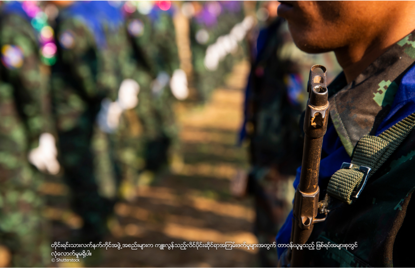
တိုင်းရင်းသားလက်နက်ကိုင်အဖွဲ့အစည်းများက ကျူးလွန်သည့်လိင်ပိုင်းဆိုင်ရာအကြမ်းဖက်မှုများအတွက် တာဝန်ယူမှုသည် ဖြစ်ရပ်အများစုတွင် လုံလောက်မှုမရှိပါ။

ပံတွင် ကိုယ်ထိလက်ရောက်နှင့် လိင်ပိုင်းဆိုင်ရာ ကျူးလွန်မှုများပါ ပါဝင်ပတ်သက်နေကြောင်း အစီရင်ခံစာပြချက်များအရ သိရသည်။ 510 LGBTIQ+ လူများကို ခွဲခြားဆက်ဆံခြင်းသည် လိင်တူ CRSV မှ အသက်ရှင်ကျန်ရစ်သူများ၏ အစီရင်ခံစာ နည်းပါးခြင်းသို့ ဦးတည်သွားစေပါသည်။ LGBTIQ+ အထောက်အထားများအကြောင်း လူမှုဆိုင်ရာ အမည်းစက်များနှင့် တားမြစ်မှုများသည် LGBTIQ+ တစ်ဦးချင်းစီအပေါ် CRSV ၏ လုပ်ရပ်များအတွက် ထိရောက်သော ကုစားမှု မရှိခြင်းကိုလည်း ဖြစ်ပေါ်စေပါသည်။ 511