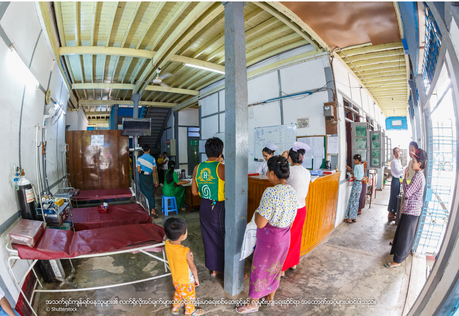
အသက်ရှင်ကျွန်ုပ်တို့အဖို့အသုံးပြုသူများ၏ လက်ရှိလိုအပ်ချက်များထဲတွင် ကျန်းမာရေးစစ်ဆေးခန်းနှင့် လူမှုစီးပွားရေးဆိုင်ရာ အထောက်အပံ့များပါဝင်ပါသည်။