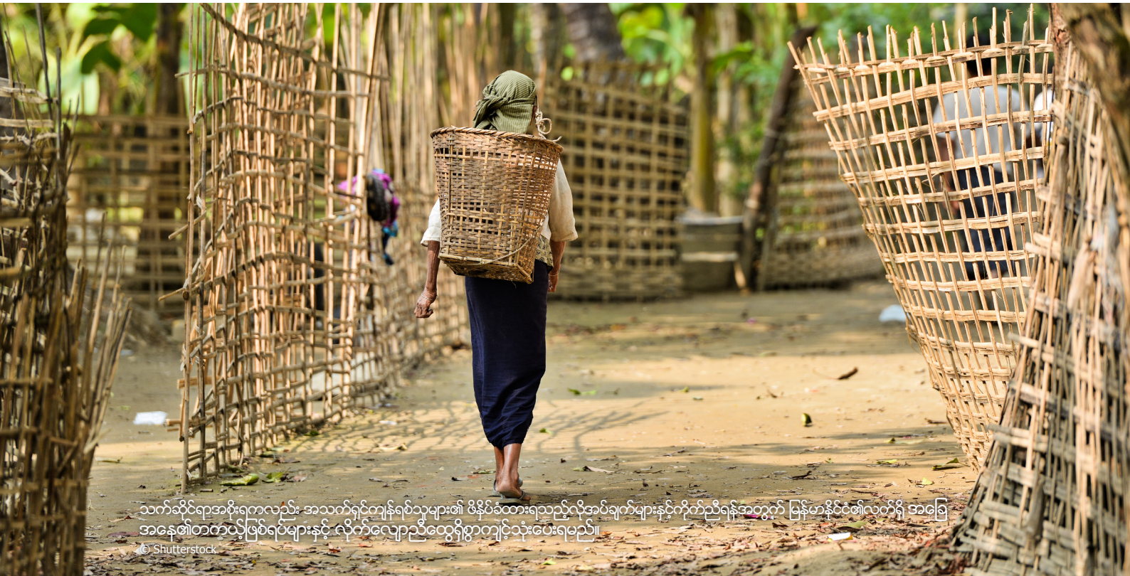
သက်ဆိုင်ရာအစိုးရကလည်း အသက်ရှင်ကျန်ရစ်သူများ၏ ဖိနှိပ်ခံစားရသည့်လိုအပ်ချက်များနှင့်ကိုက်ညီရန်အတွက် မြန်မာနိုင်ငံ၏လက်ရှိ အခြေ အနေ၏တက်လှုပ်ဖြစ်ရပ်များနှင့် လိုက်လျောညီထွေရှိစွာကျင့်သုံးပေးရမည်။

မည်သို့ဆိုစေကာမူ အနာဂတ်လျော်ကြေးပေးခြင်းဆိုင်ရာစီမံကိန်းများ တွင် အန္တရာယ်အပေါ် အကဲဖြတ်ခြင်းတစ်ခု၊ ၎င်းတို့၏ရေရှည်တည်တံ့ ခိုင်မြဲမှုကိုသေချာစေရန်အစီအစဉ်တစ်ခုနှင့် အသက်ရှင်ကျန်ရစ်သူများ၏ ပါဝင် ဆောင်ရွက်မှုနှင့် အဓိကကျမှုတို့ကိုသေချာစေရန် သင့်လျော်သော လုပ်ငန်းစဉ်တစ်ခုပါဝင်မည်ဖြစ်ပါသည်။