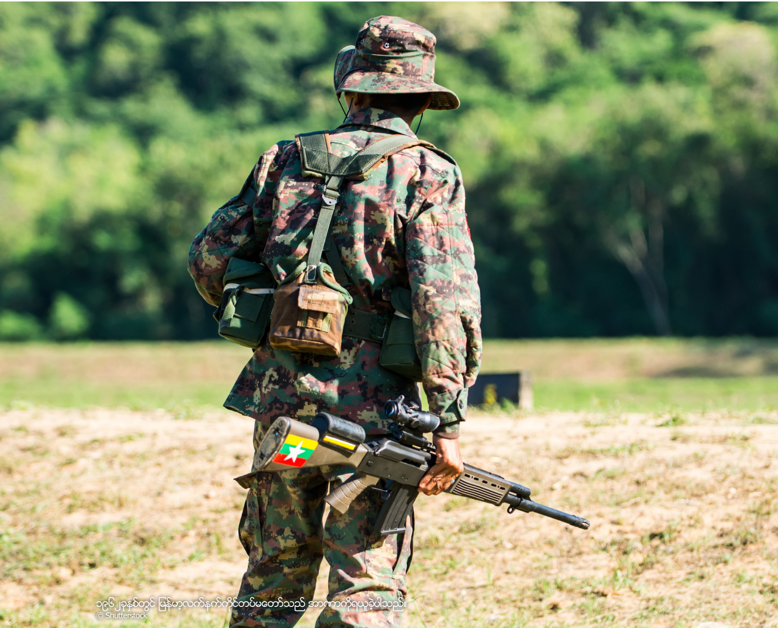
၁၉၆၂ ခုနှစ်တွင် မြန်မာ့လက်နက်ကိုင်တပ်မတော်သည် အာဏာကိုရယူခဲ့ပါသည်။

အခြားပါဝင်ပတ်သက်သူများ၏ အမြင်များနှင့် အသက်ရှင်ကျန်ရစ်သူများ၏ ဦးစားပေးအရာများဟု ၎င်းတို့ထင်မြင်ယူဆထားသည်များကို တင်ပြရန် တောင်းဆိုထားသော အခြားသက်ဆိုင်သူများ၏ အမြင်များ၊ ဤအရာက များစွာတန်ဖိုးရှိသော ထိုးထွင်းသိမြင်မှုကို ပေးစွမ်းနိုင်ပါသည်။ သို့သော်လည်း၊ အသက်ရှင်ကျန်ရစ်သူများ၏ သဘောထားအမြင်နှင့်ပတ်သက်သော ဤလေ့လာမှုတွင် တွေ့ရှိချက်သည် တစ်ပတ်ရစ်သတင်းအချက်အလက်များအပေါ် အခြေခံထားခြင်းဖြစ်သည်ဟူသောအချက်သည် စင်တာရှိ ကွဲပြားသော အသက်ရှင်ကျန်ရစ်သူအသံများဖြင့် နောက်ထပ်သုတေသနပြုလုပ်ရန် လိုအပ်ကြောင်းကို မီးမောင်းထိုးပြသည့် အရေးကြီးသော ကန့်သတ်ချက်တစ်ခုဖြစ်သည်။